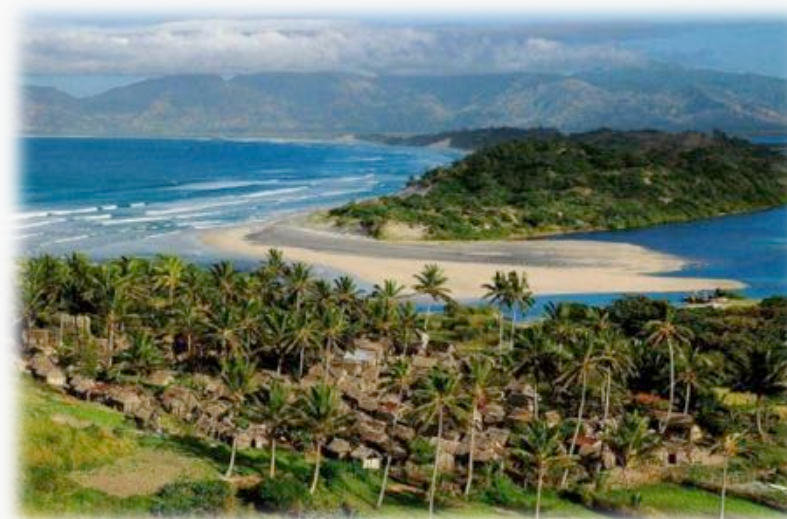
La baie de Fort Dauphin.